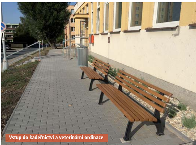
Vstup do kadeřnictví a veterinární ordinace