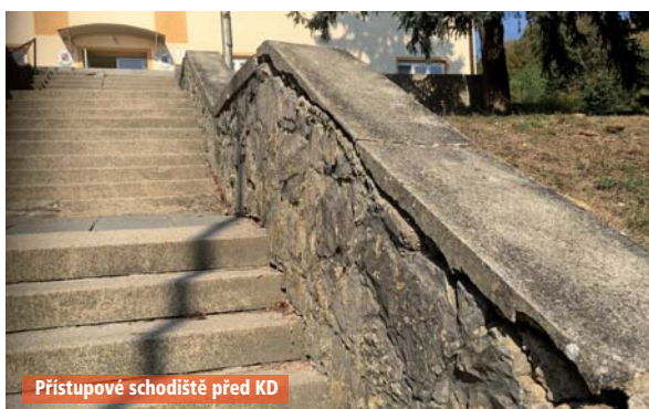
Přístupové schodiště před KD