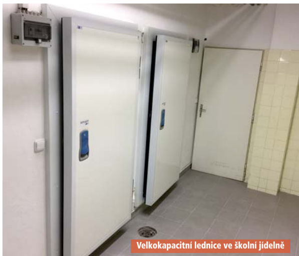
Velkokapacitní lednice ve školní jídelně