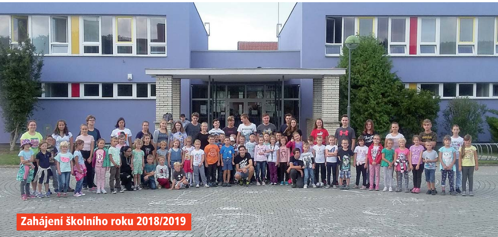
Zahájení školního roku 2018/2019

www.mokra-horakov.cz • vychází zdarma v nákladu 1150 ks