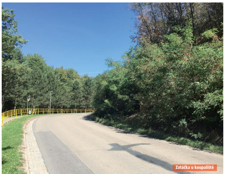
Zatáčka u koupaliště

doucí zastupitelstvo tuto dotaci dotáhne do zdárného konce... A řidičům a chodcům se tímto místem bude bezpečněji projíždět bez obav, že nám na hlavu něco spadne!