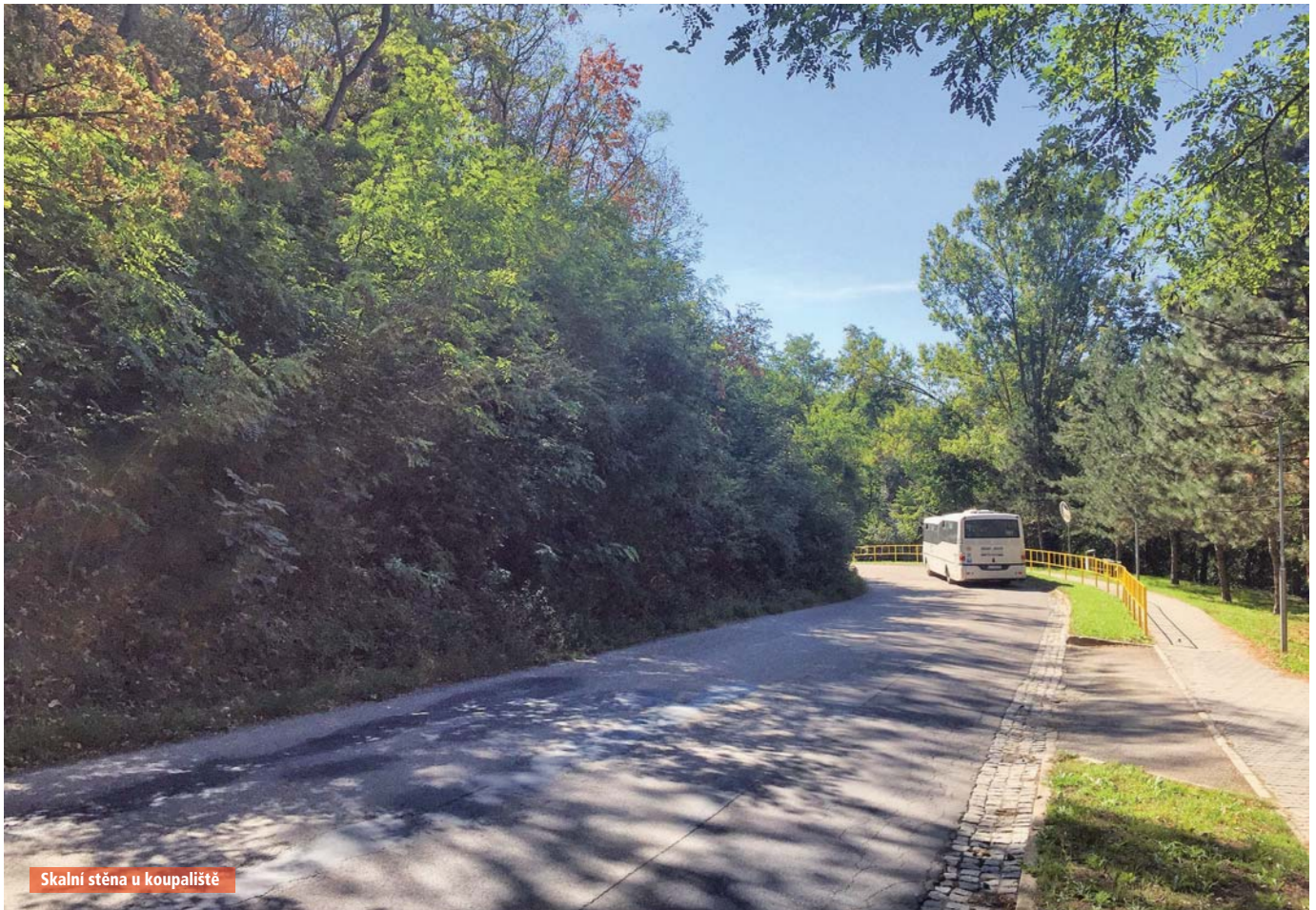
Skalní stěna u koupaliště