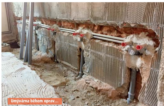
Umývárna během oprav...