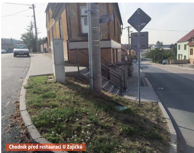
Chodník před restaurací U Zajíčků

Byl vybudován chodník před Domovem s pečovatelskou službou v Horákově. Snahou bylo propojit chodníky před křižovatkou, doposud museli chodci vstupovat do silnice. Stavbu provedla firma Reichmont.