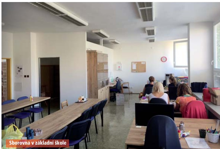
Sborovna v základní škole