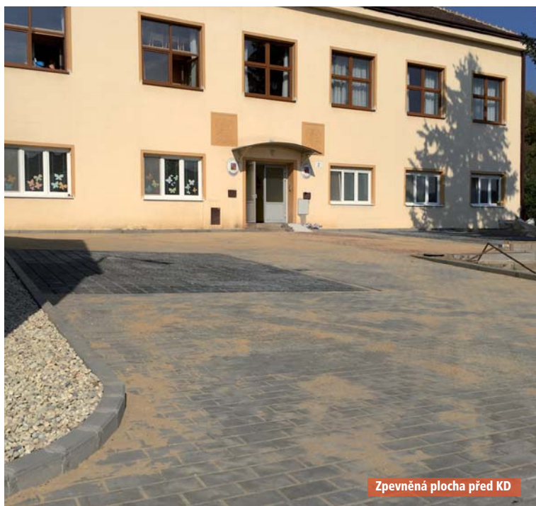
Zpevněná plocha před KD

Byla zpevněna plocha před vstupem do mateřské školy a kulturního domu, vznikla tu parkovací místa. Stavbu prováděla firma Creative Buildings. V příštím roce je potřeba řešit přístupové schodiště při vstupu do Kulturního domu, které je v havarijním stavu.