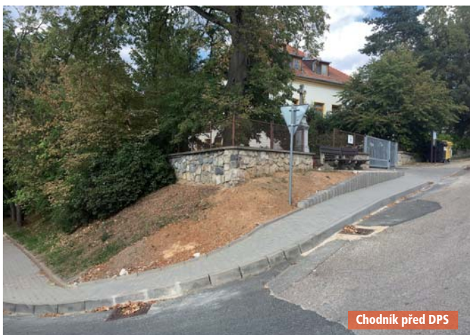
Chodník před DPS

Bylo vybudováno další parkoviště 3. a 4. etapa, vzniklo zde 34 nových parkovacích míst, v minulosti se zde parkovalo na trávě. Práce provedla firma Veselý.