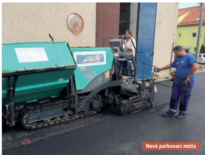
Nová parkovací místa

Byl opraven vstup do kadeřnictví a veterinární ordinace a bezbariérový vstup na poštu. Práce provedla firma IDPS.