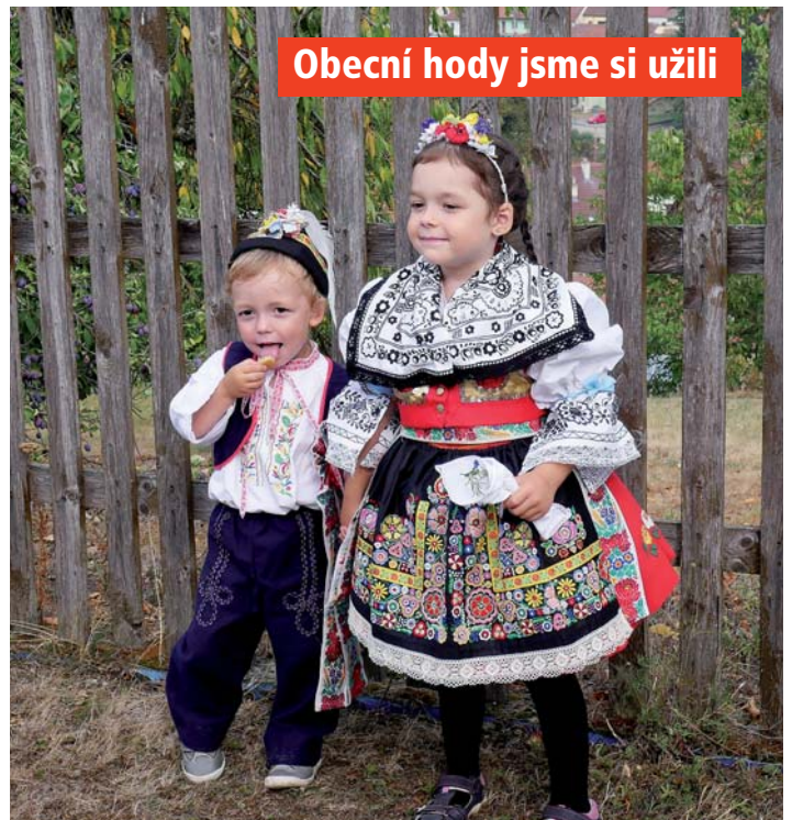
Obecní hody jsme si užili

Projekty obce v letech 2015–2018 – str. 10