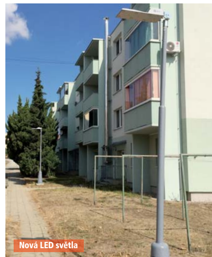
Nová LED světla