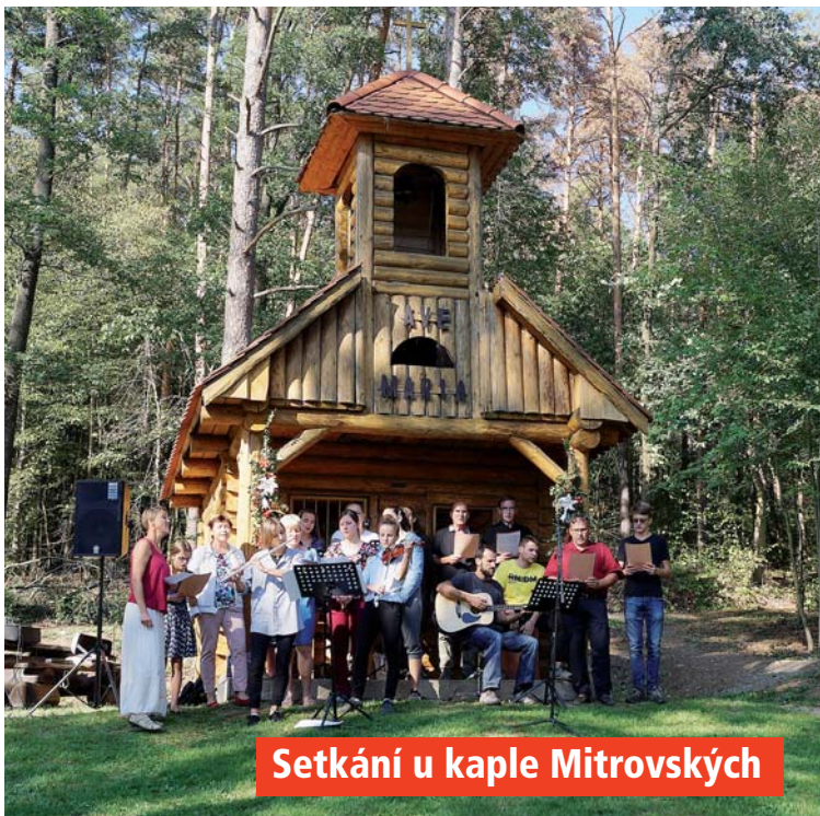
Setkání u kaple Mitrovských