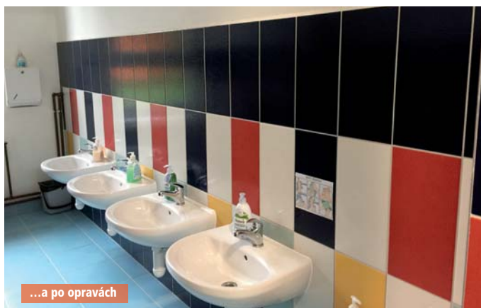
...a po opravách