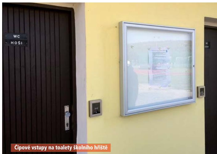
Čipové vstupy na toalety školního hřiště

sociální zařízení, které otevře svým čipem. Problém, který bohužel zůstává a na který hodně z Vás poukazuje, je nedodržování provozního řádu některými sportovci. Existují návrhy, jak situaci řešit, ale to bude již na nově zvoleném zastupitelstvu a radě obce.