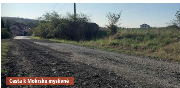
Cesta k Mokrské myslivně