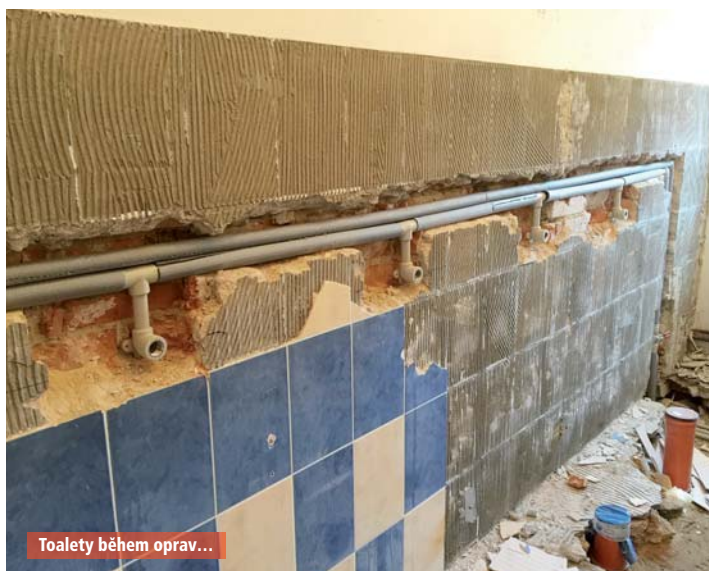
Toalety během oprav...