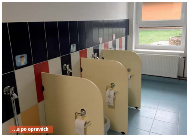
...a po opravách