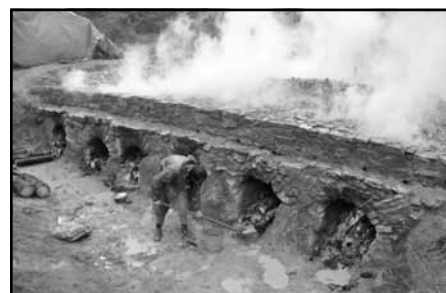
Obsluha pece za vytrvalého deště