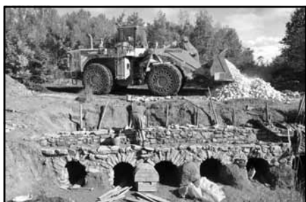
Příprava vápenky k provozu. Dovoz suroviny.