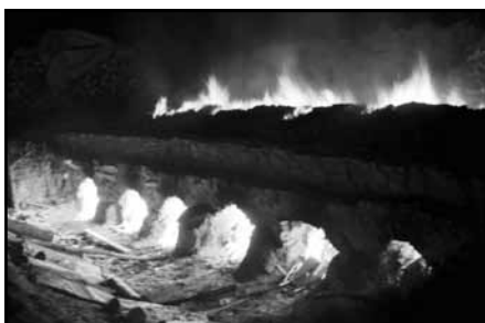
Pec při nočním provozu