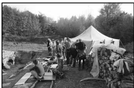
Zázemí experimentálního areálu