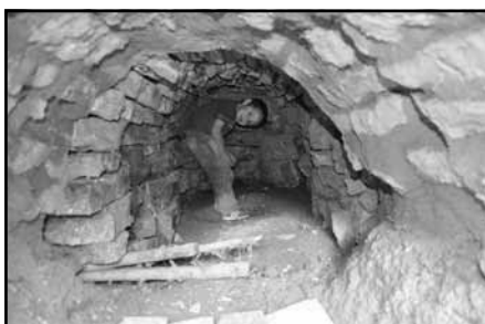
Pohled do útroby spalovacího kanálu s roštěm