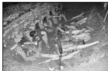
Z nočního pálení první noc