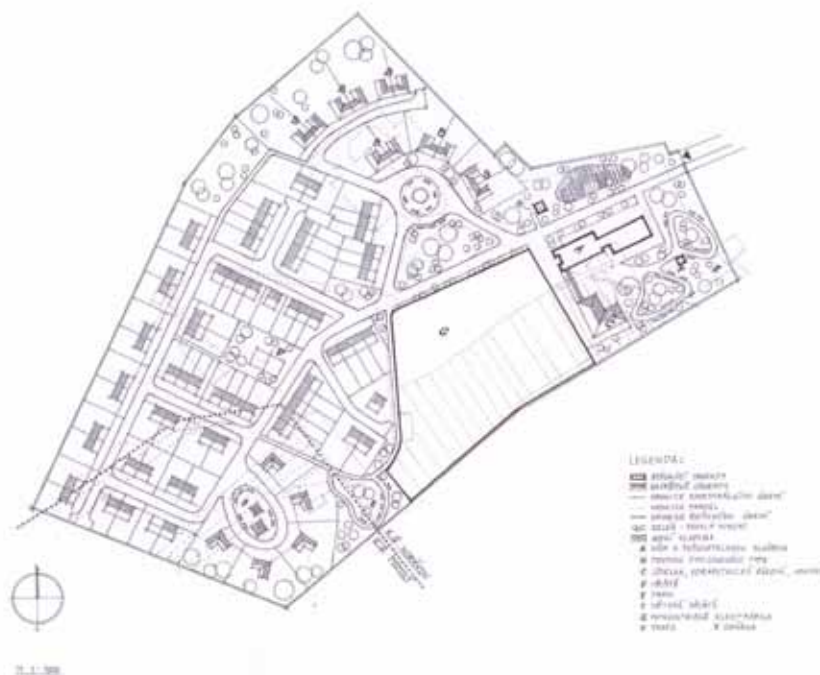
ZASTAVOVACÍ STUDIE AREÁLU BÝVALÉ VOJENSKÉ HLÁSKY HORÁKOV