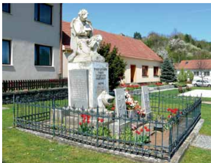
26. dubna položilo vedení obce květiny k výročí osvobození obcí Mokrá a Horákov.