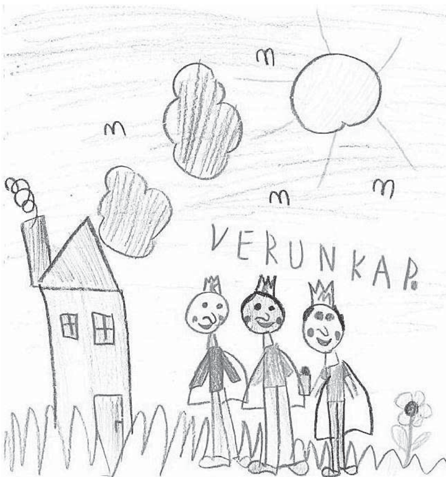
Obrázek získali koledníci od holčičky z Horákovy