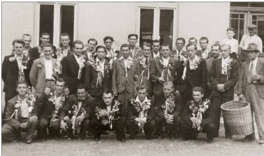
Horákovští rekruiti 1945