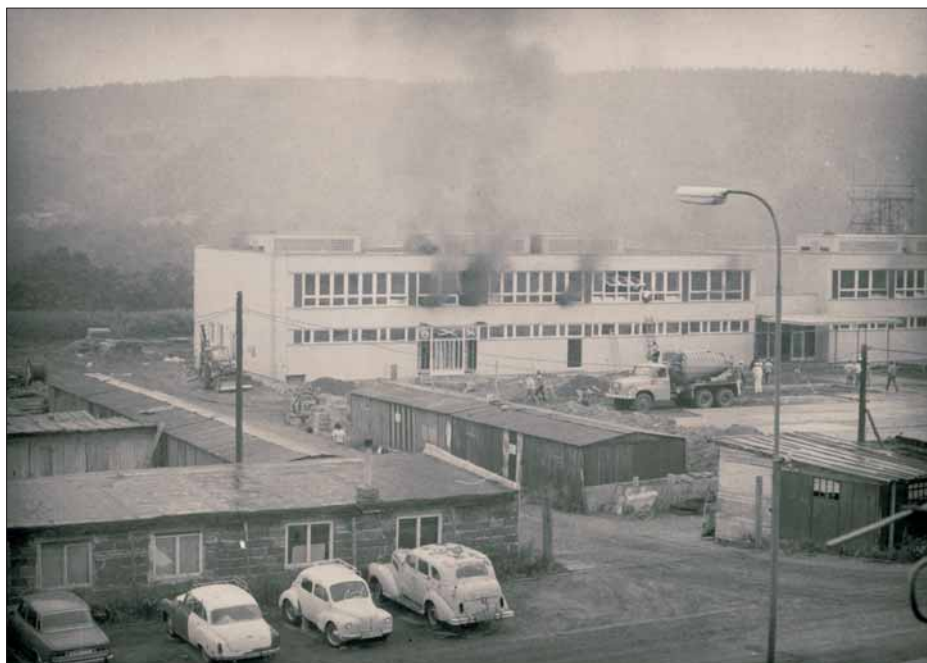
ZŠ Mokrý – požár před dokončením