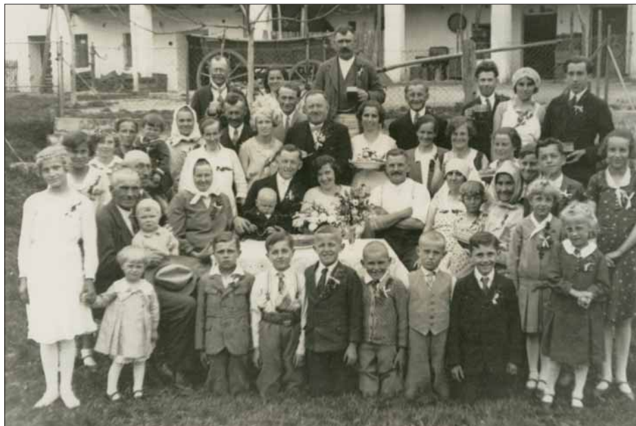
K. Zajíček – svatba manželů Zemanových cca 1933