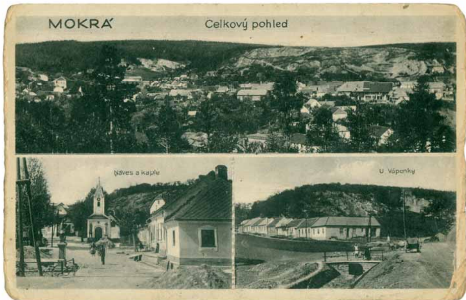
J. Poláček – Mokrá, celkový pohled